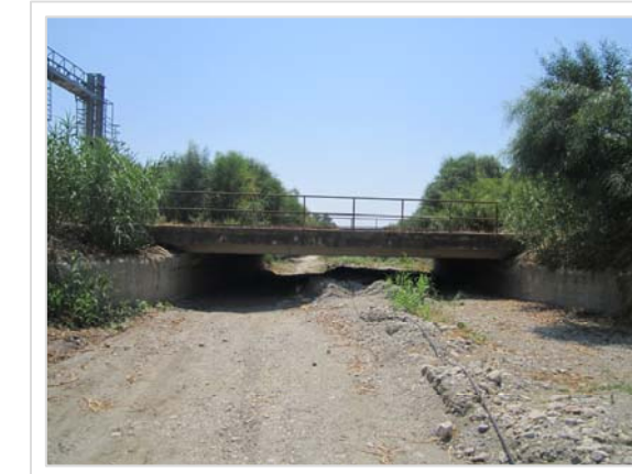
A. Attraversamento ferroviario Condofuri Marina