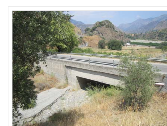
F. Attraversamento Strada Provinciale n° 7 Località Acan