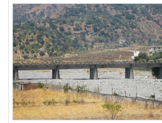
7. Attraversamento Strada Provinciale n° 7 Località Carcara