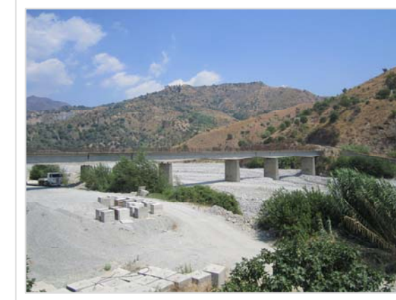
5. Attraversamento Strada Comunale Amendolea Località Rodi