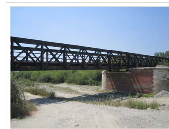
4. Attraversamento ferroviario Condofuri Marina