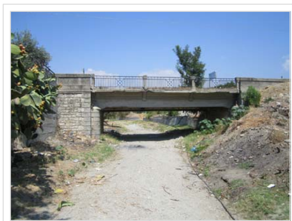
1. Attraversamento stradale Viale Peripoli Condofuri Marina