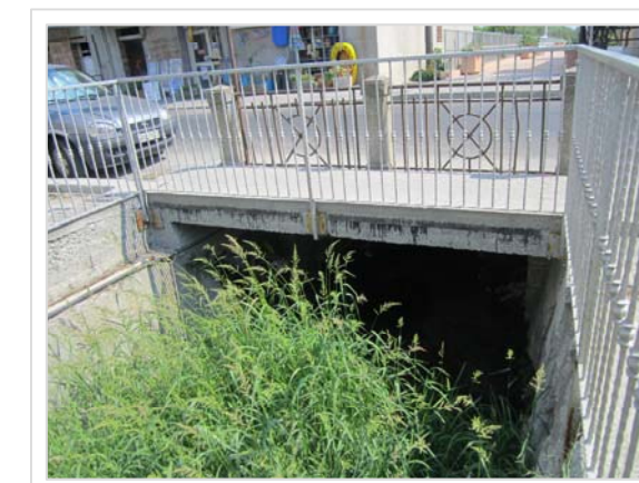
B. Attraversamento stradale Viale Peripoli Condofuri Marina