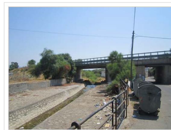
3. Attraversamento stradale S.S. 106 Condofuri Marina