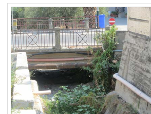
C. Attraversamento stradale Viale Peripoli Condofuri Marina