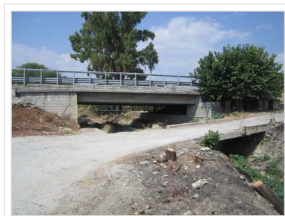
2. Attraversamento stradale S.S. 106 Condofuri Marina