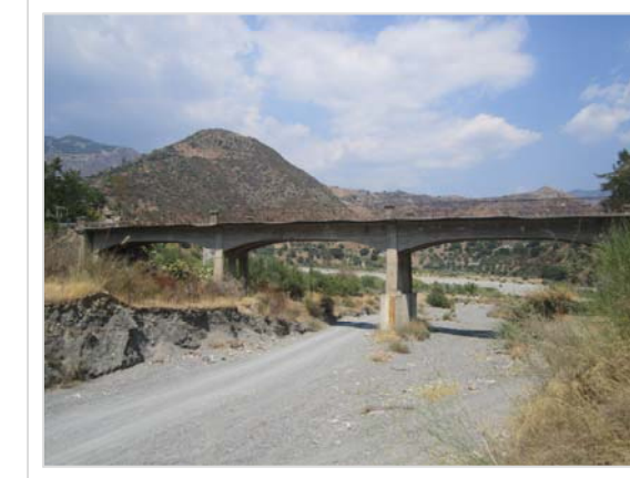
6. Attraversamento Strada Provinciale n° 7 Località Lapse