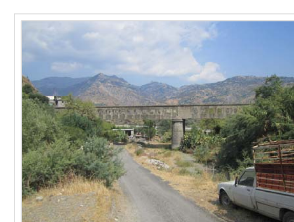
G. Attraversamento S.P. 7 "Ponte Lapse" Località Schiavo