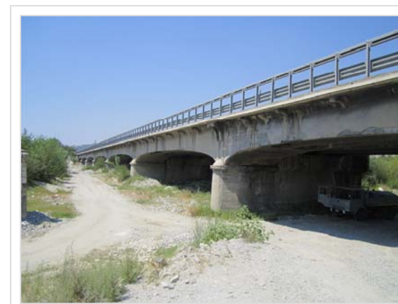
4. Attraversamento stradale S.S. 106 Condofuri Marina