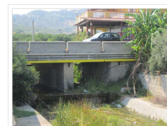
D. Attraversamento stradale Via Duca D'Aosta Località Lagarà