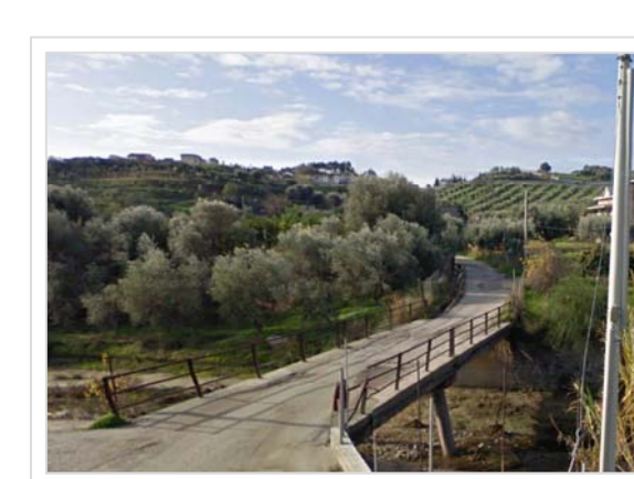
E. Attraversamento stradale Via Santa Lucia Località Santa Lucia