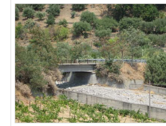
9. Attraversamento Strada Provinciale n° 7 Condofuri Capotugno