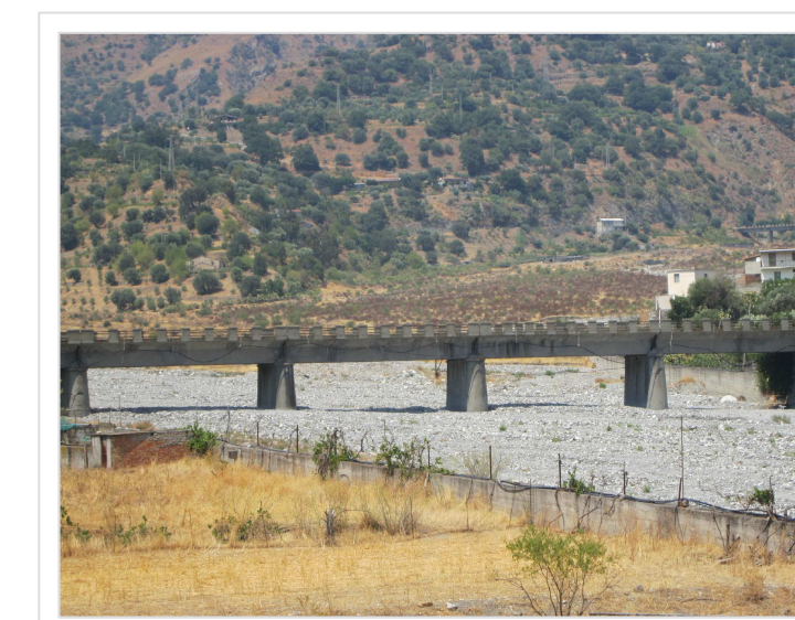
7. Attraversamento Strada Provinciale n° 7 Località Carcara