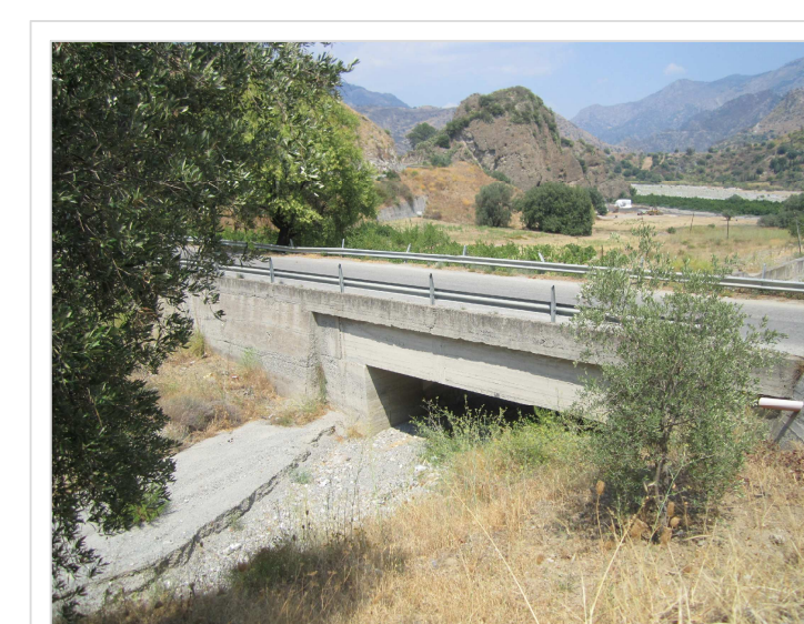
F. Attraversamento Strada Provinciale n° 7 Località Acan