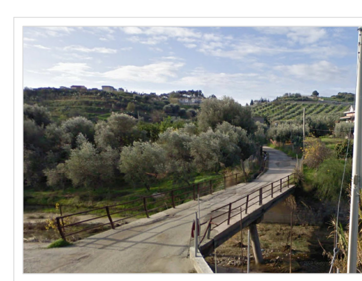
E. Attraversamento stradale Via Santa Lucia Località Santa Lucia