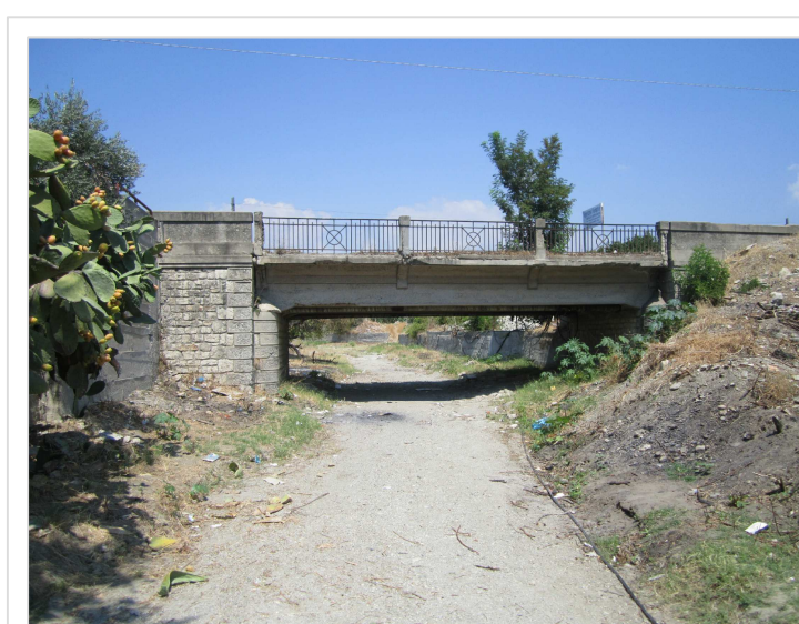
1. Attraversamento stradale Viale Peripoli Condofuri Marina