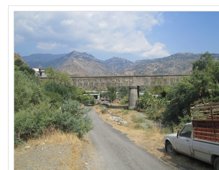
G. Attraversamento S.P. 7 "Ponte Lapse" Località Schiavo