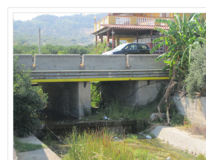
D. Attraversamento stradale Via Duca D'Aosta Località Lagarà