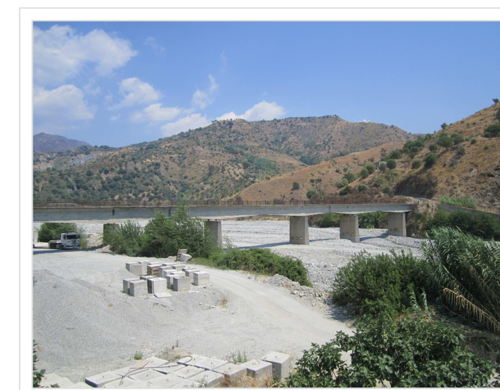
5. Attraversamento Strada Comunale Amendolea Località Rodi