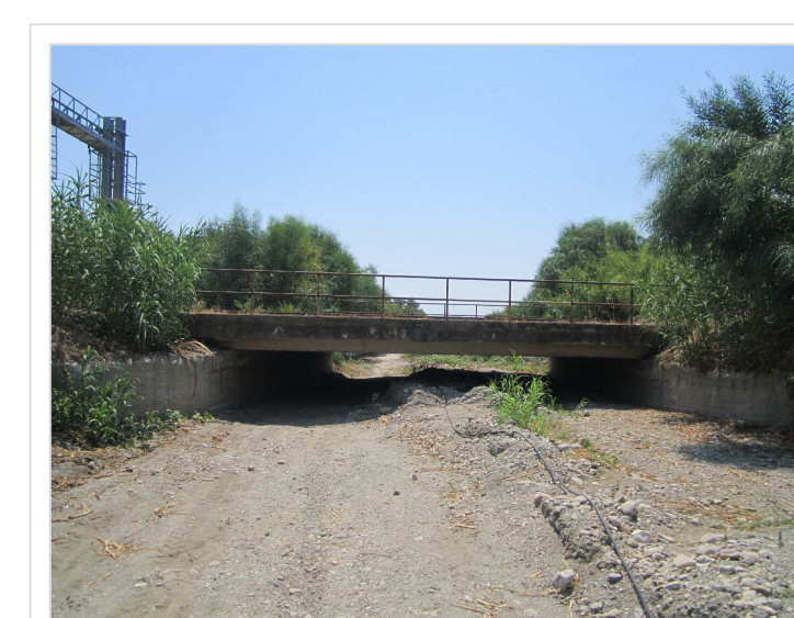
A. Attraversamento ferroviario Condofuri Marina