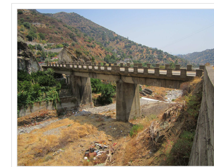
8. Attraversamento Strada Provinciale n° 7 Località Mangani