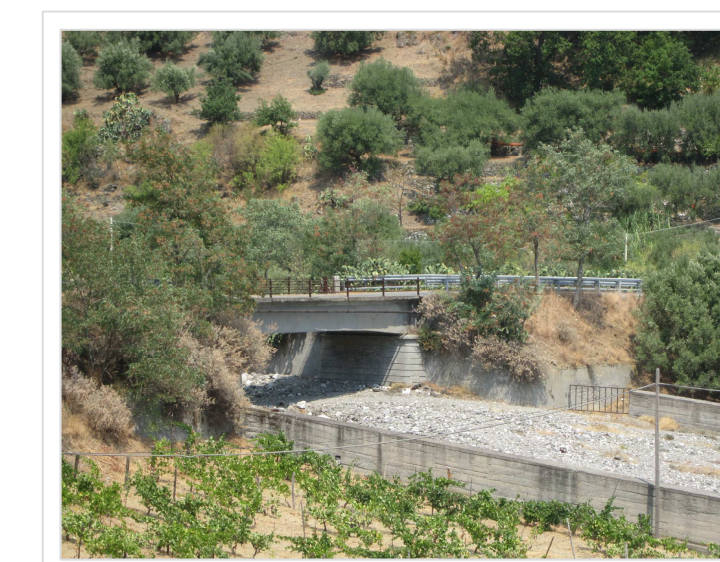
9. Attraversamento Strada Provinciale n° 7 Condofuri Capotugno