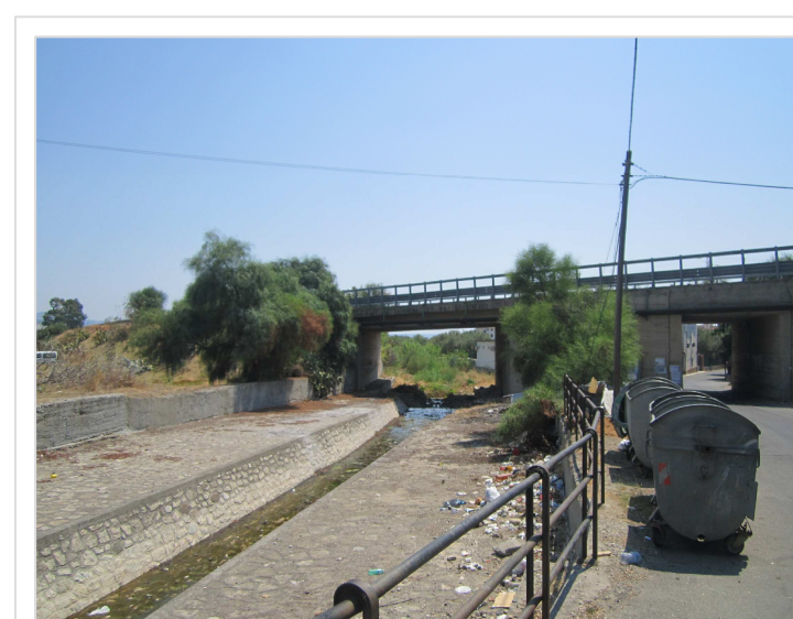
3. Attraversamento stradale S.S. 106 Condofuri Marina