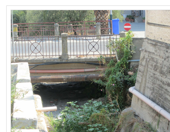
C. Attraversamento stradale Viale Peripoli Condofuri Marina