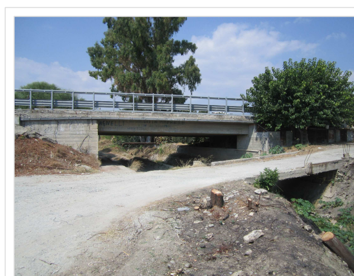
2. Attraversamento stradale S.S. 106 Condofuri Marina