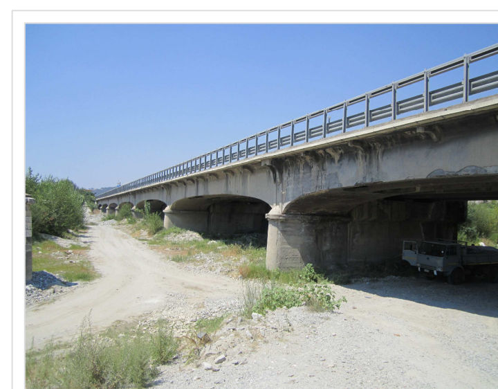
4. Attraversamento stradale S.S. 106 Condofuri Marina