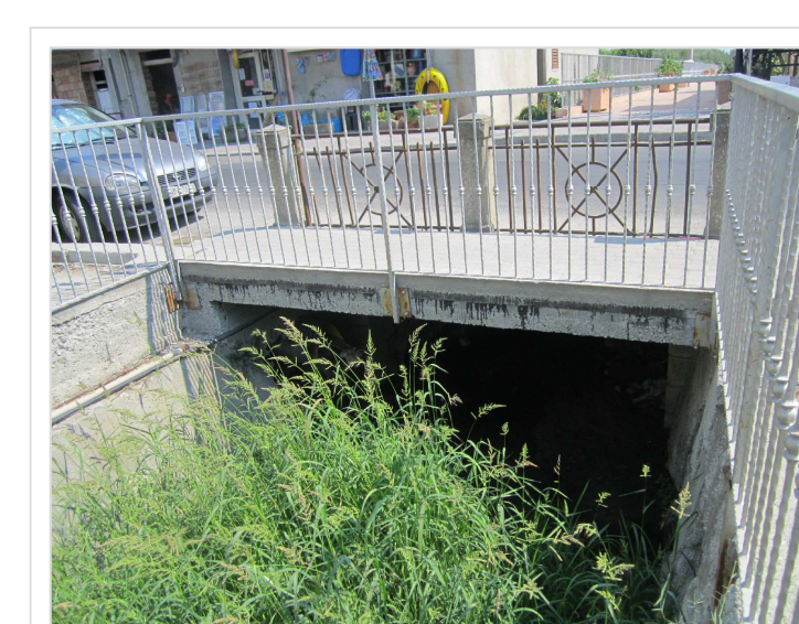
B. Attraversamento stradale Viale Peripoli Condofuri Marina