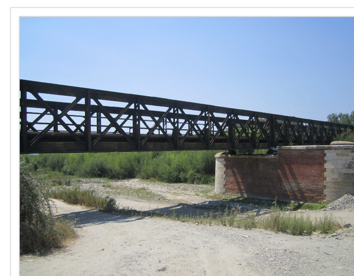
4. Attraversamento ferroviario Condofuri Marina