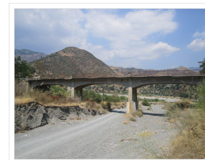
6. Attraversamento Strada Provinciale n° 7 Località Lapse